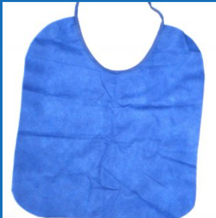
Babero odontológico (x unidad)