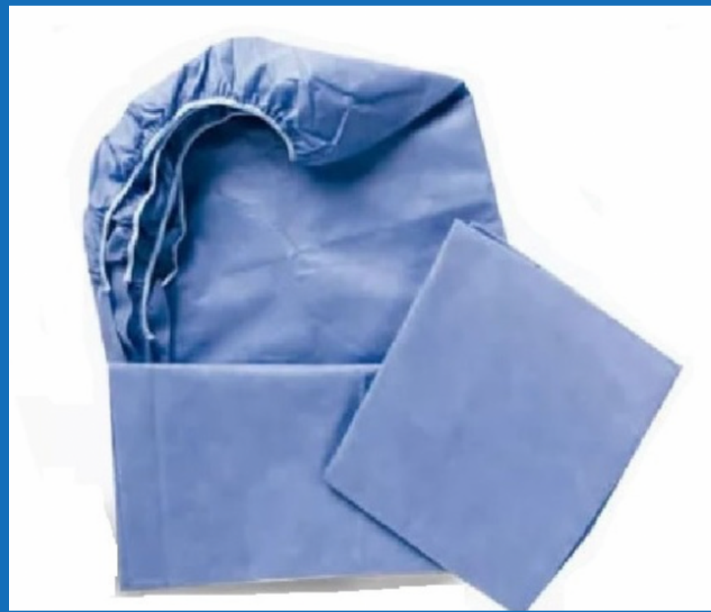
Rollo de camilla 80 x 100 cm con o sin soporte