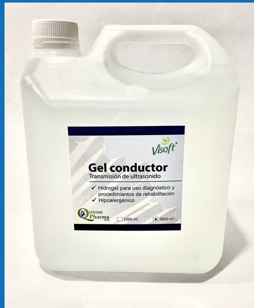
Gel conductor transparente