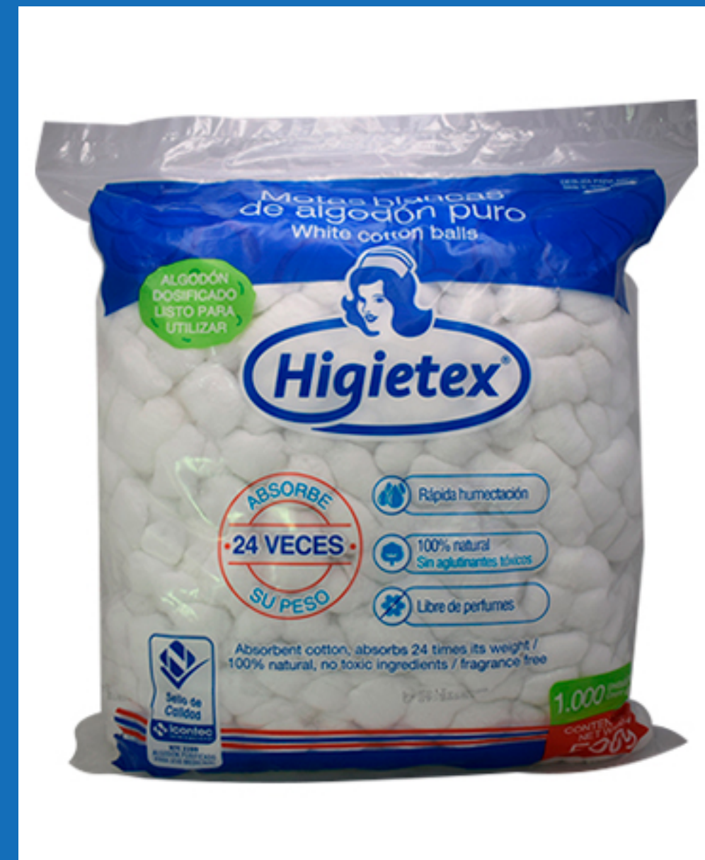
Torundas x 1000 unidades