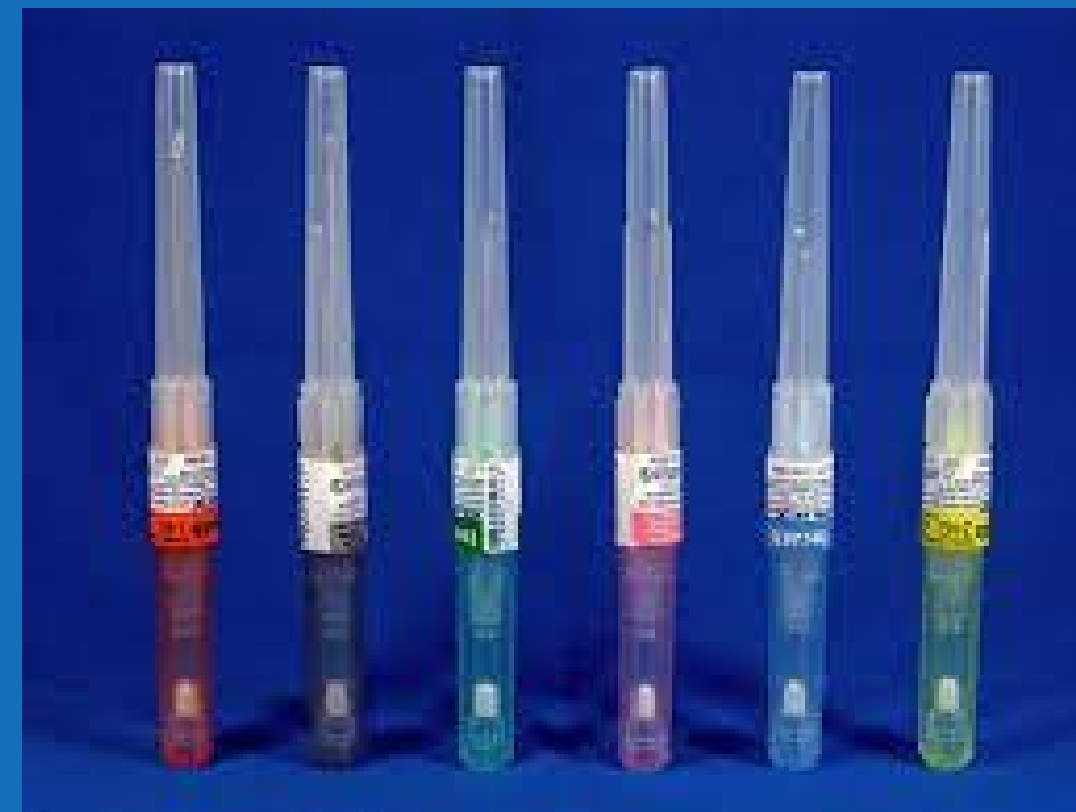
Bránulas de seguridad x unidades