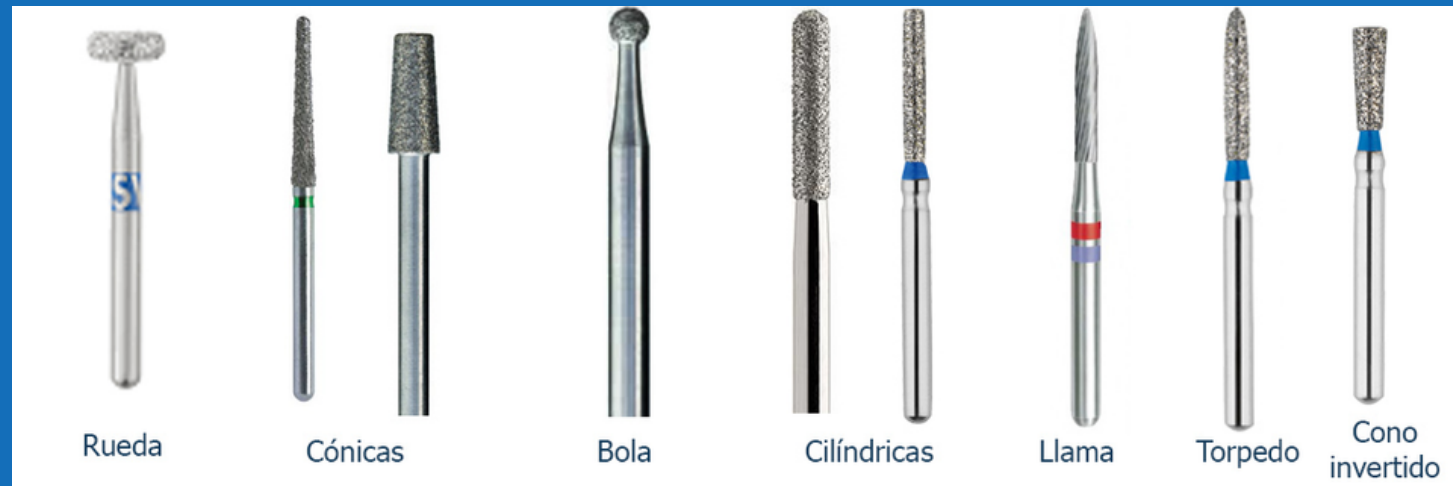
Rueda Cónicas Bola Cilíndricas Llama Torpedo Cono invertido