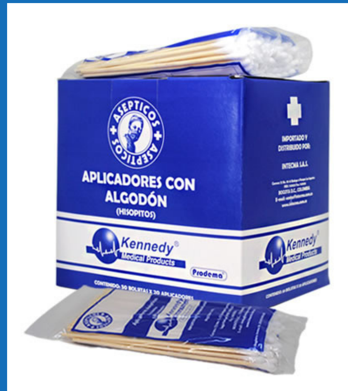
Aplicadores bolsa x 100 unidades