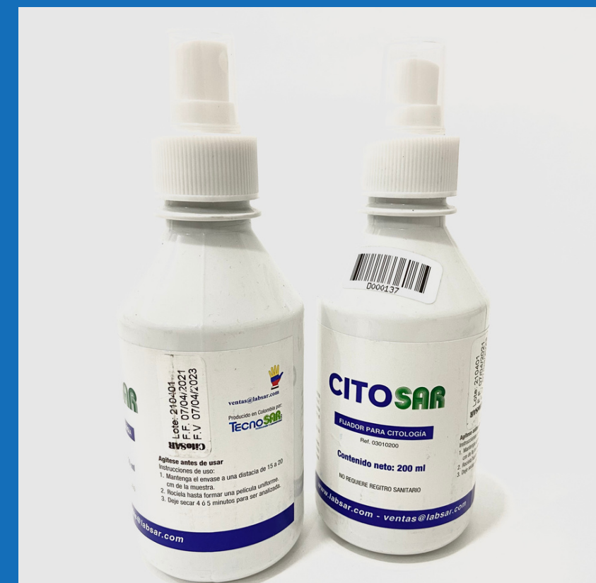
Spray Citofijador (x unidad)