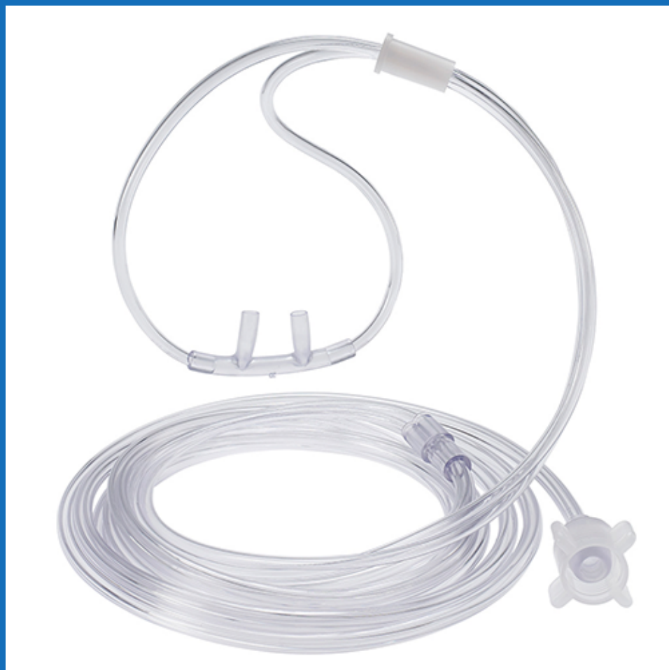
Cánula de oxígeno adulto y pediátrico, empaque individual