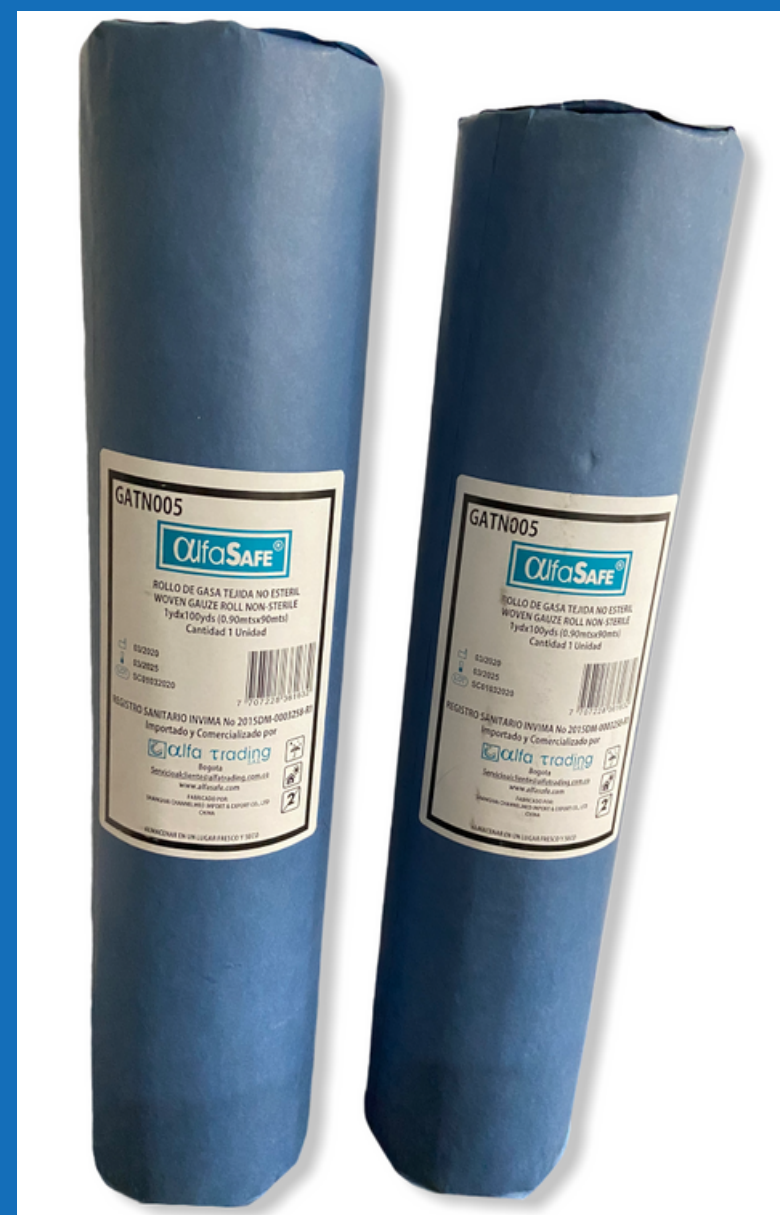
Gasa hospitalaria 100 yardas