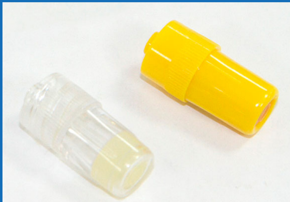
Cateter heparinizado x unidades