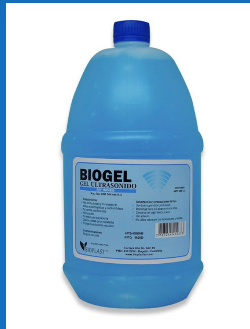
Gel conductor azul