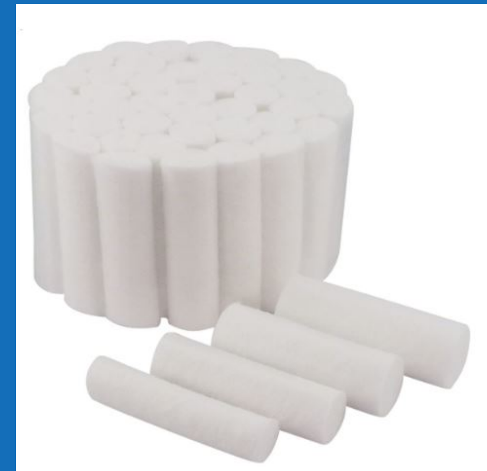
Taco de Algodon X 1000 unidades