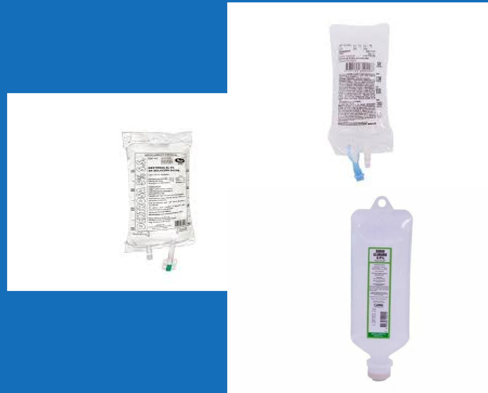
Líquidos endovenosos 100cc, 250cc, 500cc, x unidades