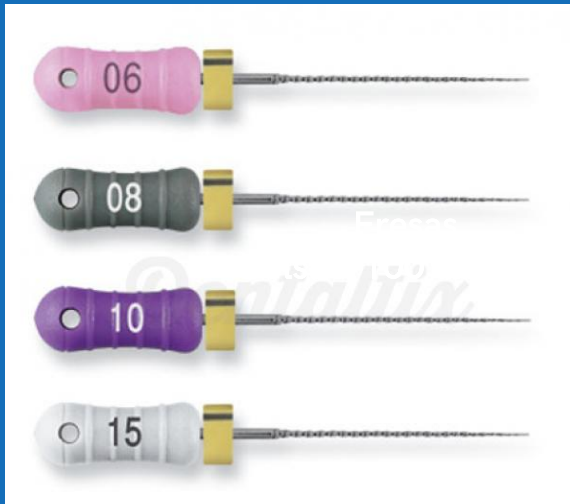
Pre Serie Caja x 5 Unidades