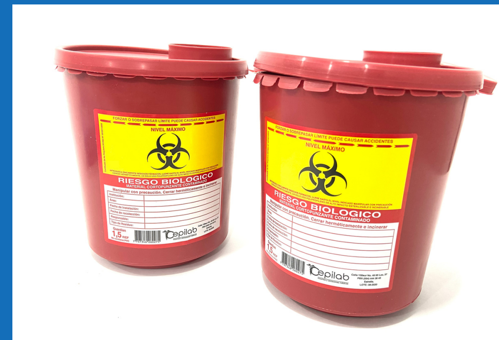
Recolectores de agujas: 1L - 1.5 L - 2.9 L