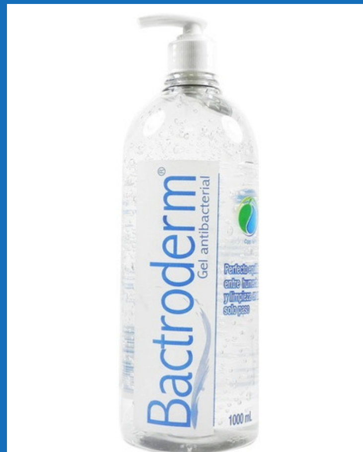
Alcohol Glicerinado 1L