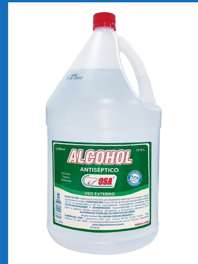
Alcohol antiséptico al 70% GL