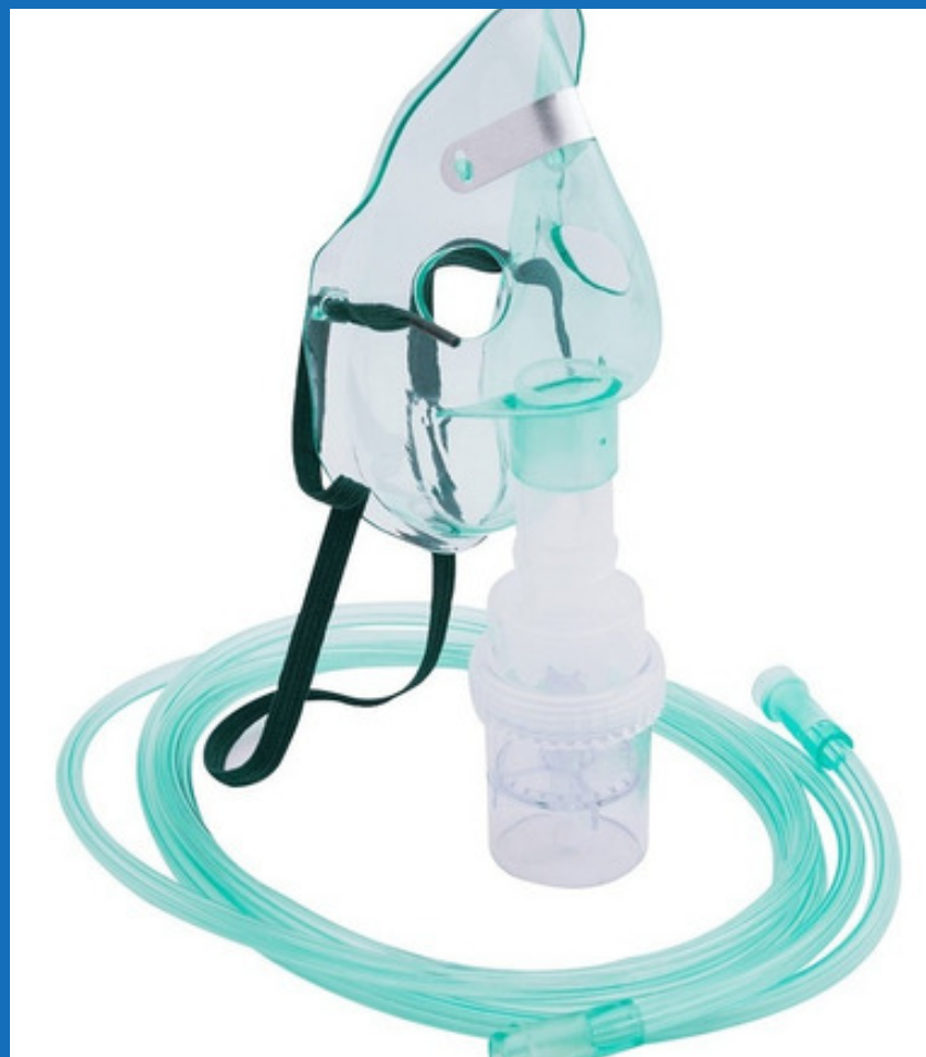
Micronebulizador adulto y pediátrico, empaque individual