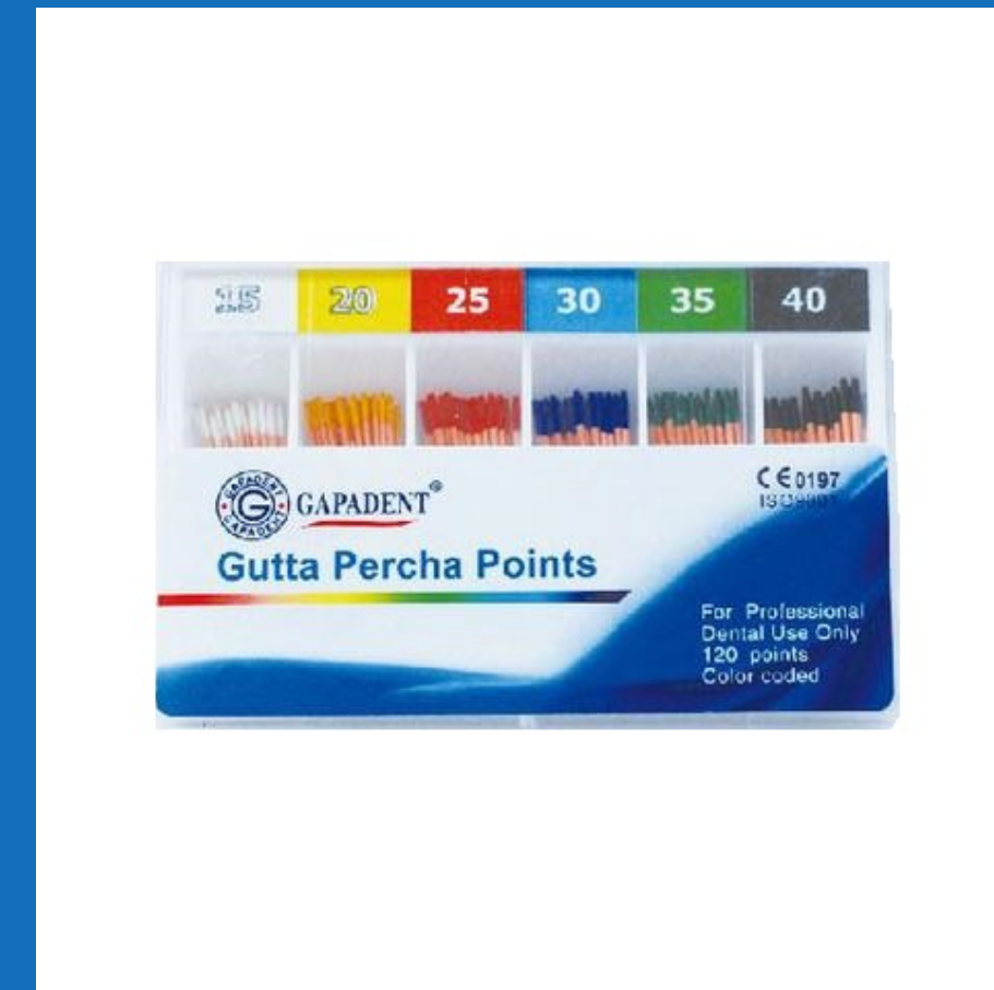
Conos de gutapercha Caja x 6 colores