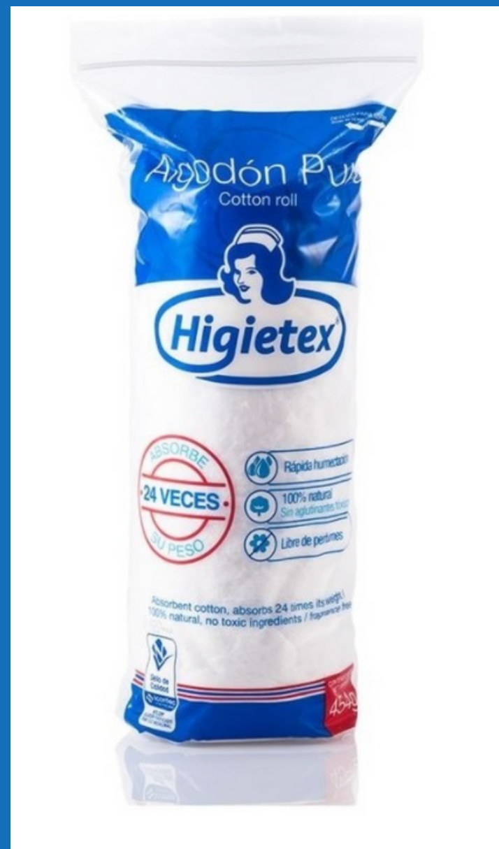
Laminado x 454 grs