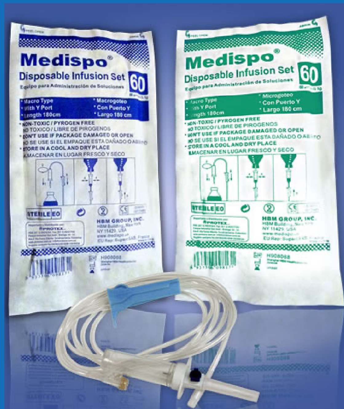
Equipo de macrogoteo Empaque individual