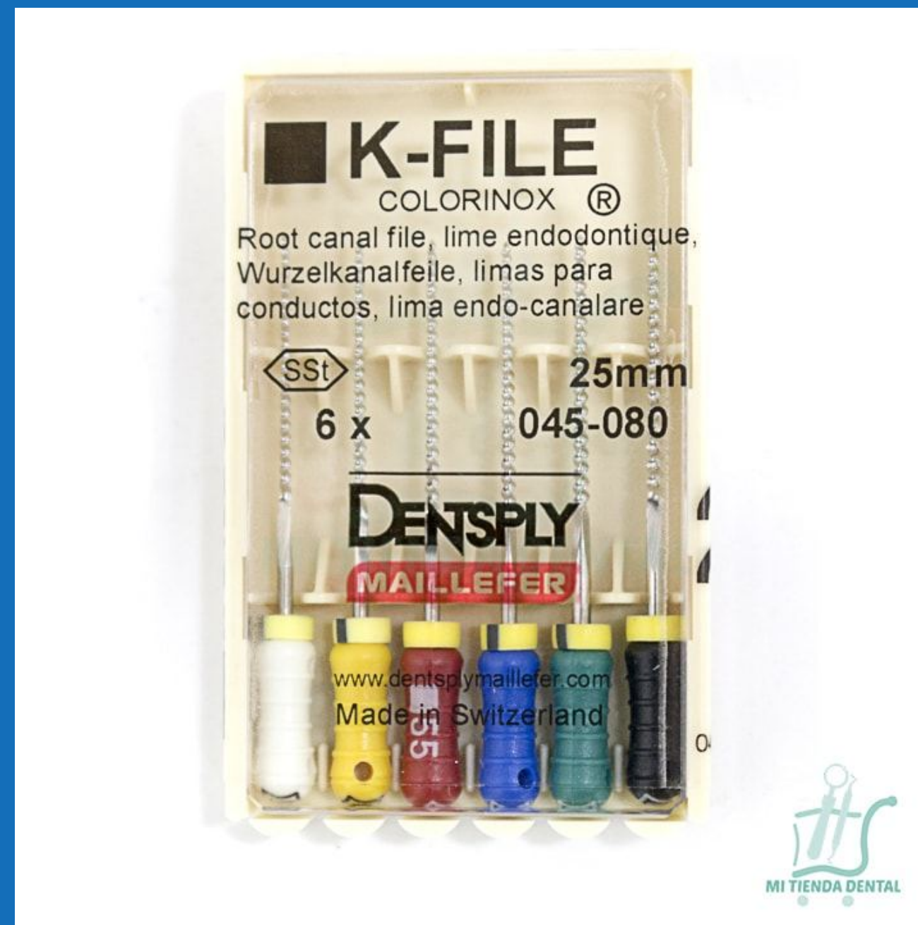
Primera Serie Caja X 6 unidades