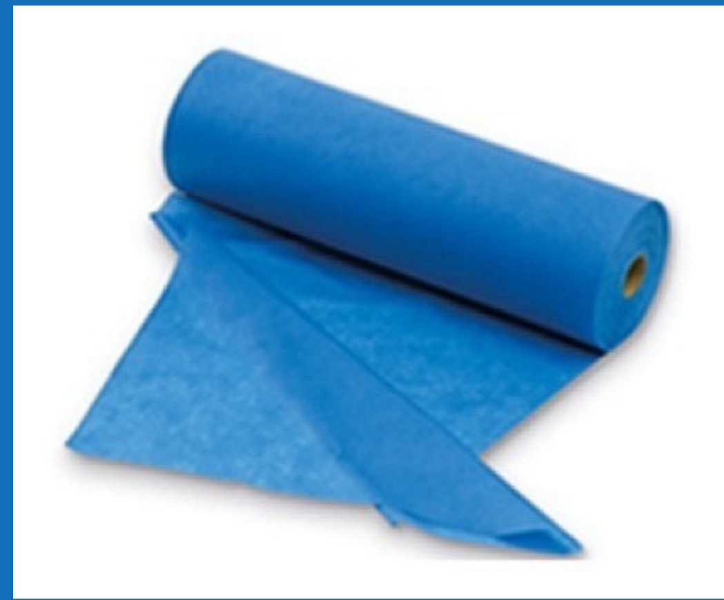
Sábana resortada para camilla 2 x 1mts Paquete por 10 unidades