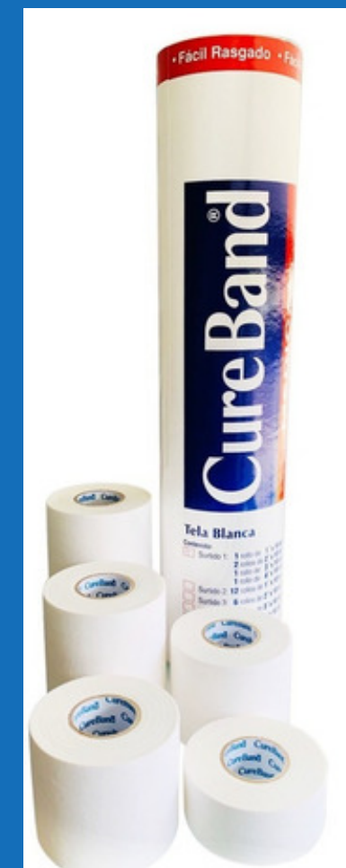
Micropore piel y blanco 1 y 2 pulgadas