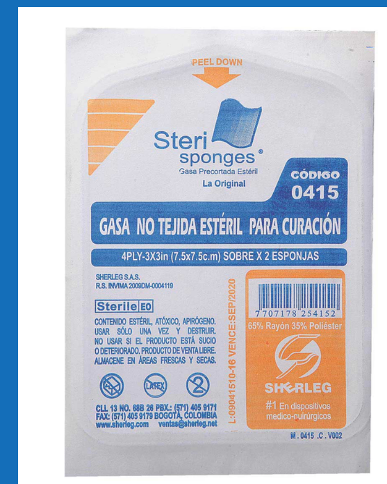
Gasas estériles no tejidas 7.5 x 7.5 cms