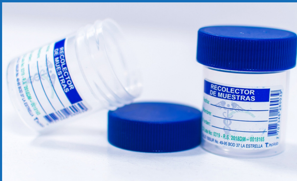
Recolectores de muestras azúl y rojo, bolsa x 100 unidades