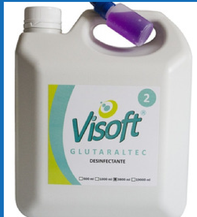
Glutaraldehido al 2% GL