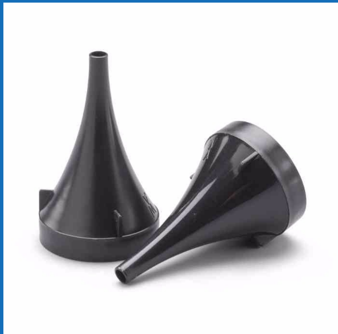
Espéculo de otoscopio bolsa x 34 unidades