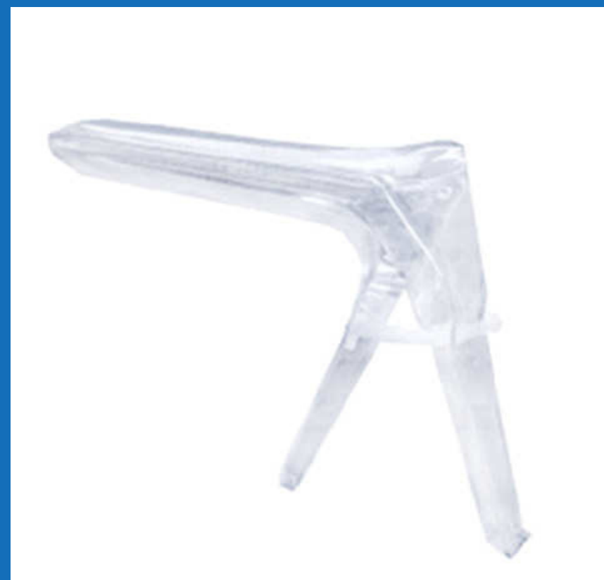
Espéculos vaginales Tallas S y M (x unidad)