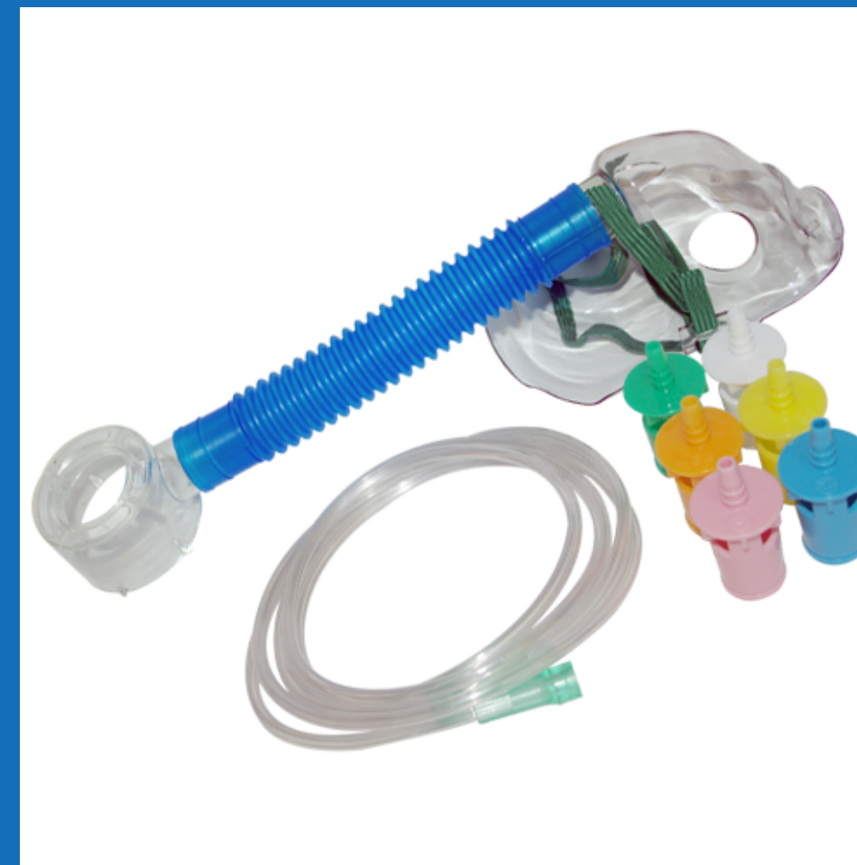
Venturi adulto y pediátrico, empaque individual