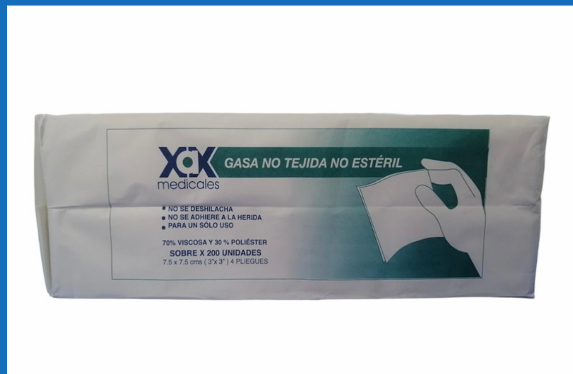
Gasas limpias sobre x 200 unidades